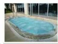
露天ジャグジーもあります！